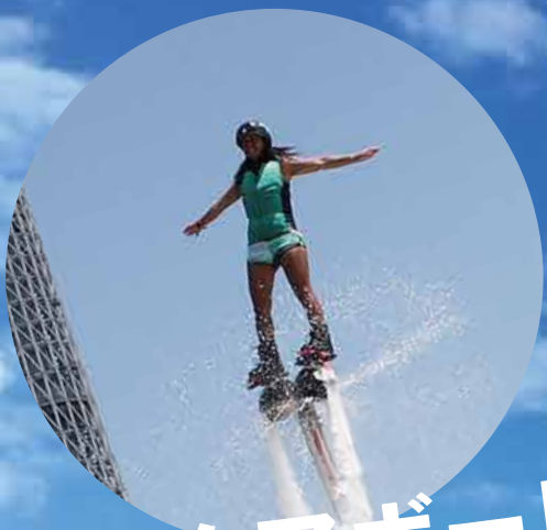
アクアボード フライングショー