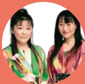
Marimba Duo なつかよ

2006年1月に結成。ドライブとパンチの効いたダイナミックなプレイ。クラシックや、ラテン、Jazz、アフリカ音楽など、息のあった2人で1台のマリンバを演奏する。今までに、オペラシティ、日本テレビ、三茶De大道芸、東京丸の内、上野公園へブブアーティストイベントなど各地イベントに参加し好評を得ている。その他の活動として、企業のパーティー、商工会、忘年会、新年会、老人ホーム、デイケアセンター、保育園、保育園などでも演奏活動中。