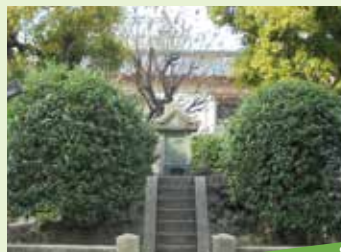
2 妙亀塚 スタンプ台紙設置