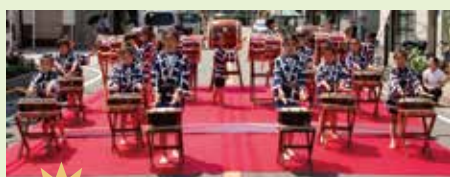
仰願寺幼稚園わんぱく太鼓