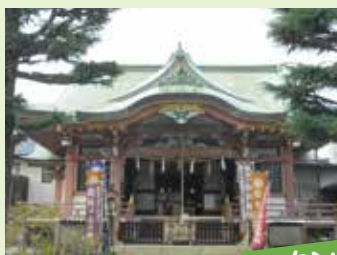
3 今戸神社 スタンプ台紙設置