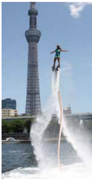
アクアボード フライングショー