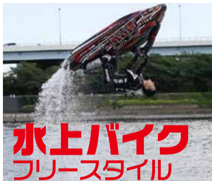
水上バイク フリースタイル