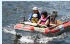
スーパーキッズボート (エンジン付ゴムボート)

定員: 午前の部(30組:1隻2名まで) 午後の部(30組:1隻2名まで) 条件: 幼稚園年長以上でライフジャケットが正常に着用できること。小学生未満は保護者の同伴が必要となります。