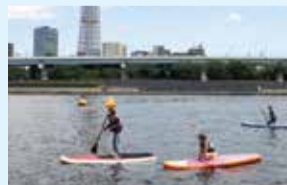
SUP (スタンドアップパドルボード)

定員: 午前の部(5組:1隻2名まで) 午後の部(5組:1隻2名まで) 条件: 幼稚園年長以上でライフジャケットが正常に着用できること。中学生以下は保護者の同伴が必要となります。