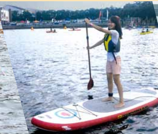
スタンドアップパドルボード