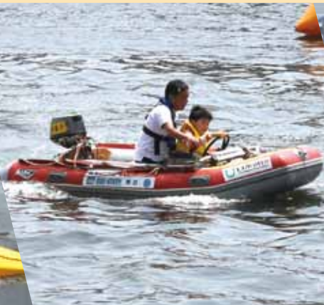
スーパーキッズボート