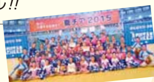
National Dance Team Championship 2015優勝 TIGGERS DANCE TEAM

さまざまな音楽、チアダンス など盛りだくさんのステージ を楽しみながら世界の料理 を召し上がれ!